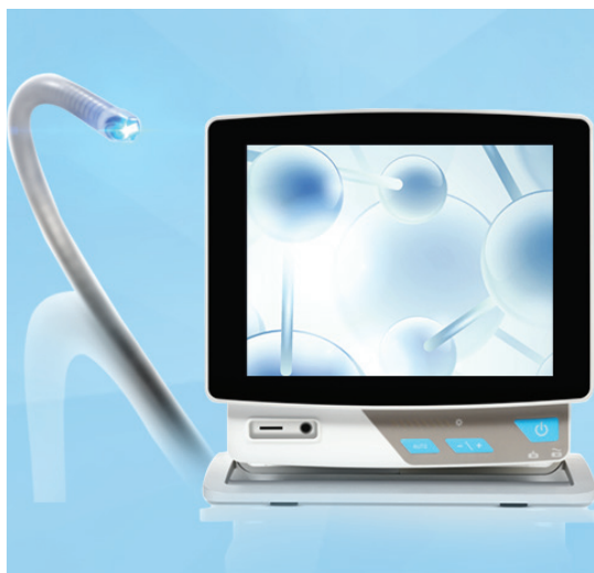
Consola Eview UTV100